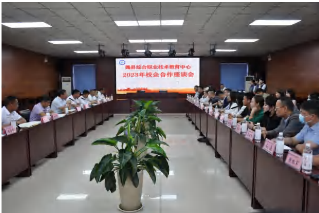
图12：校企合作座谈会暨集中签约仪式

其中，应届毕业生满意度为99.06%，毕业三年内毕业生满意度为98.89%，用人单位满意度为100%，毕业生面向三次产业就业人数133人，其中，面向第一产业53人，面向第二产业57人，面向第三产业23人。