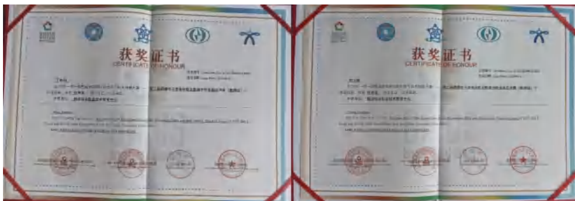
图27：教师在2023年一带一路暨金砖国家技能发展与技术创新大赛第二届跨境电子商务及数据分析比赛中荣获优秀奖