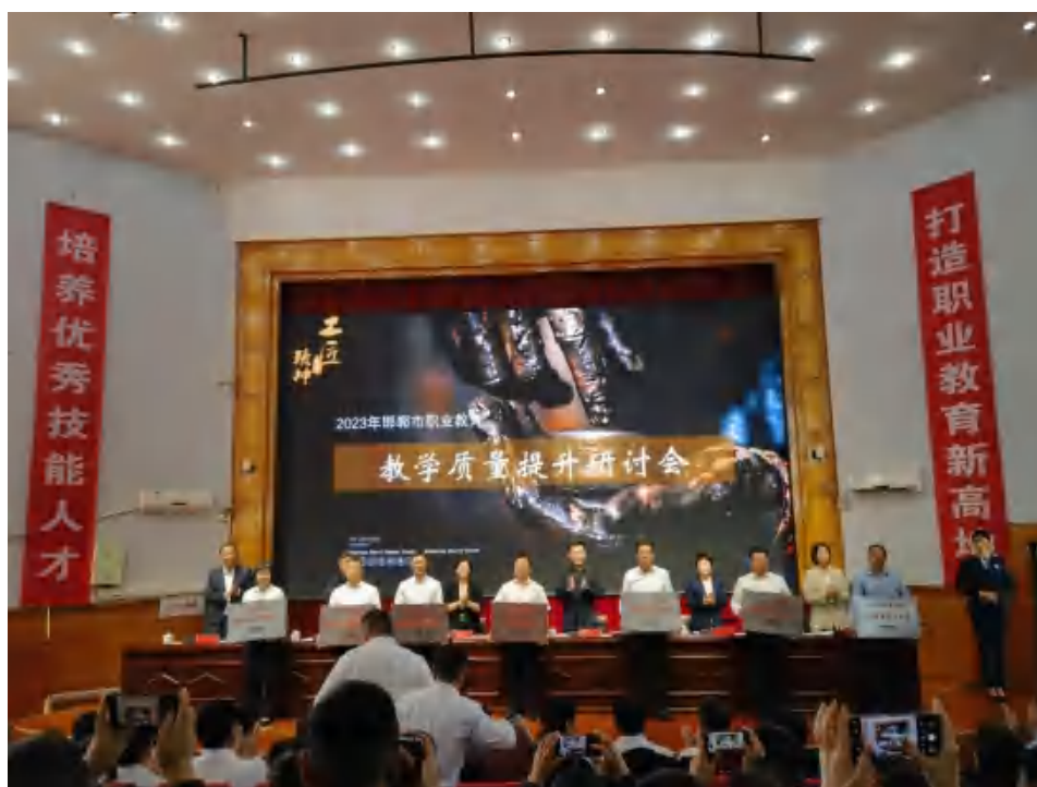
图1：2023年邯郸市职业教育教学质量提升研讨会

1.1 学校概况。魏县综合职业技术教育中心，简称魏县职教中心，始建于1994年7月，是一所融职业高中、中专、中短期培训于一体的综合性公办中等职业学校，是河北省重点中等职业学校、河北省中等职业教育质量提升工程项目学校（“120”名牌校）、河北省教育工作先进集体、河北省园林式单位、河北省“3+2”“2+2+2”贯通培养学校、邯郸市职业教育教学质量先进单位、邯郸市首批中等职业教育特色学校、邯郸市文明校园，同时，也是全国计算机应用水平考试（NIT）考试点和培训机构、国家“1+X”证书制度试点学校、河北省电子行业特有工种职业技能实训基地、河北省首批与阿里巴巴集团跨境电商人才培训合作职业院校。