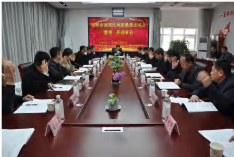
图28：邯郸市南部区域职教集团成立暨第一届理事会

按照市教育局的统一安排部署，2023年3月24日，邯郸市南部区域职教集团成立大会暨第一届理事大会在学校召开，并举行了揭牌仪式。学校当选为第一届理事长单位。