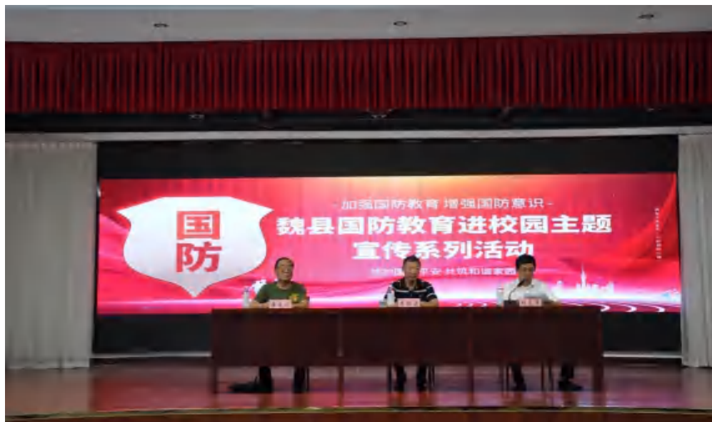
图5：国防教育进校园主题宣讲系列活动