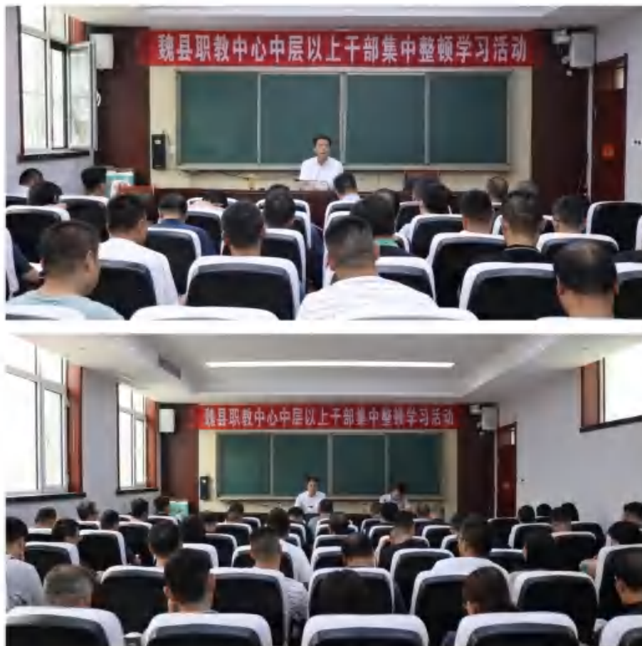
图30：中层以上干部集中整顿学习活动

据可查，促进了学校教学规范和管理提升，形成了事事有管理，时时有管理，人人服管理，人人皆管理的管理机制。