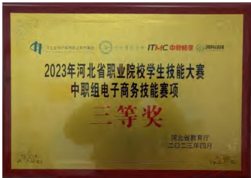
图14：河北省职业院校技能大赛获奖

2.1.7技能大赛。学校高度重视学生技能大赛工作，积极组织师生参加国家、省、市、县各级各类专业技能大赛，成立了技能大赛工作专班，建立了技能大赛激励机制，组建了参赛项目团队，制定了团队训练计划，选派专业带头人作为团队指导教师，对各团队定期进行指导训练，让学生把赛项内容融入日常的实习实训课堂，赛教融合，赛训融合，赛证融合，以赛促教，以赛促学，以赛促改，以赛促建，技能大赛成绩斐然，硕果累累，教师业务更加专业，学生技能更加精湛，进一步提升了教育教学质量和学校办学水平。2023年，学校成功承办了2023年邯郸市中等职业学校学生技能大赛4个赛项比赛，是全市承办赛项最多的学校，并荣获优秀承办单位和10个赛项优秀组织奖。2023年，学生共获奖175人次，教师共获奖84人次，其中，国家级学生获奖4人次、教师获奖5人次，省级学生获奖41人次、教师获奖28人次，市级学生获奖130人次、教师获奖51人次。