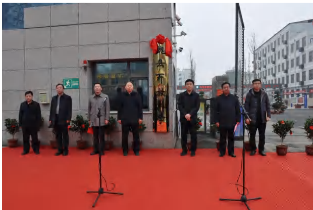
图29：魏县开放大学揭牌仪式

7.2 地方政策落实。 经过积极申报，2023年5月，学校被确定为河北省2023年“3+2”贯通培养学校，2023年11月，学校被确定为河北省2024年“2+2+2”贯通培养学校，标志着学校在高质量快速发展的道路上又迈出了坚实步伐，进一步拓宽了学生成长成才渠道，提升了学校办学层次和水平。目前，学校与河北女子职业技术学院“3+2”培养模式已完成招生40余人，与邯郸职业技术学院、河北魏福现代食品有限公司签订了“2+2+2”贯通培养协议。同时，学校还进一步扩大“3+2”合作院校，到省教育厅对接洽谈承办高等专科学历教育工作，到北京理工大学洽谈合作事宜。