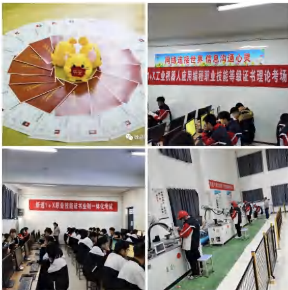
图10：“1+X”职业技能等级证书考试

按照人才培养方案开展专业技能训练，学生技能水平得到明显提升，专业技能合格率为100%；学校高度重视体育卫生工作，开齐、开足体育课、音乐课、美育课，配有体育课专任教师15人，美育课专任教师15人，音乐课专任教师8人，加强学生体质监控，学生体质健康标准测试4879人，测评合格率达96.18%；规范学籍管理，注重学业水平监控，学生毕业率达100%。