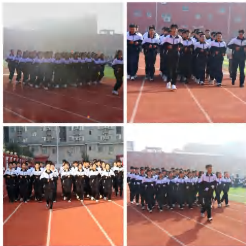
图7：队列队形跑操比赛