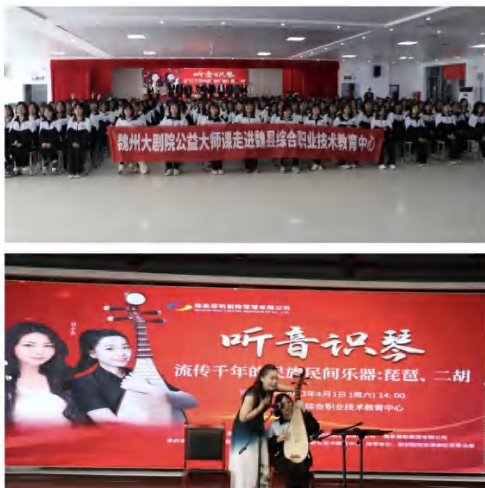
图24：民乐公益大讲堂活动