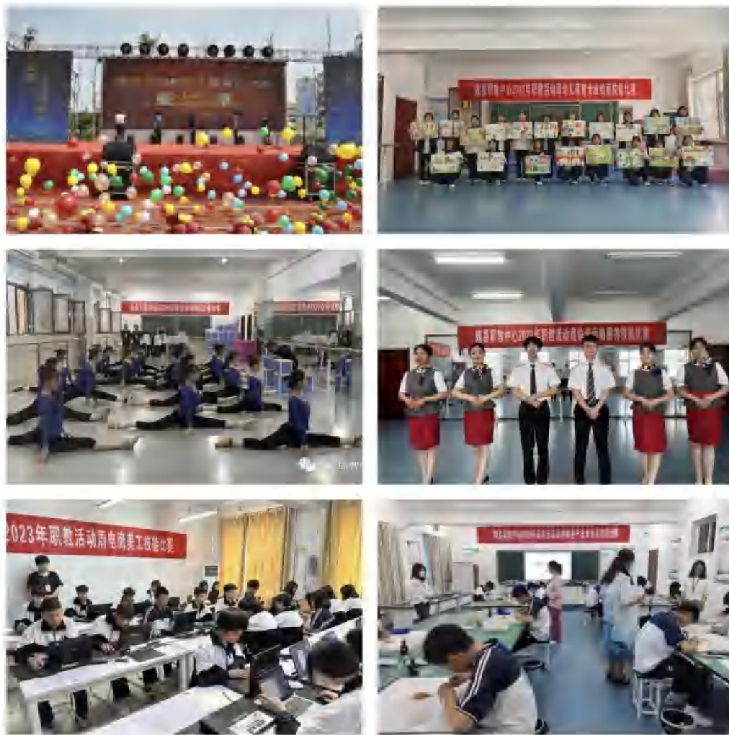
图3：2023年职教活动周启动仪式和专业技能比赛

业教育质量提升工程项目建设学校中实现升级晋位，是邯郸市唯一一所连续多年升级晋位的中职院校。