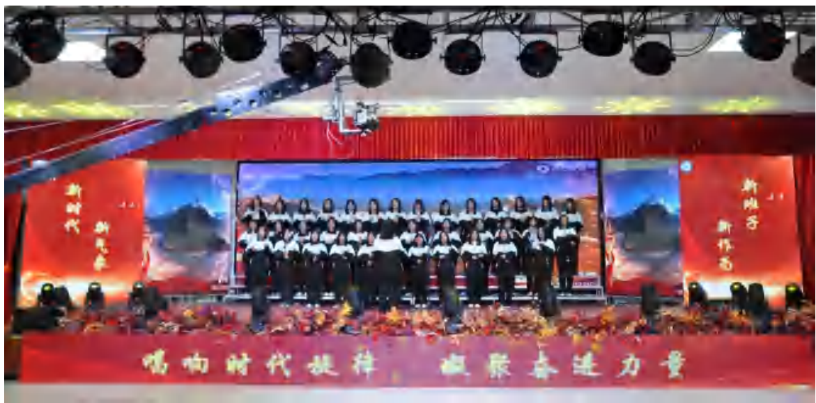
图9：迎元旦红歌合唱比赛

校风校纪校貌整顿、迎元旦红歌合唱比赛、国家奖学金颁奖、红色研学教育实践、国防教育专题讲座、民乐公益大讲堂、升国旗仪式、国旗下宣誓、国旗下讲话、班级宣誓、红色经典阅读比赛、文明宿舍评比、好人好事评比、志愿服务等活动和迎“五一”、“七一”、“十一”、元旦征文、朗诵、合唱、演讲、书画、趣味体育等比赛；每周组织学生集中观看优秀爱国主义影片，收到了较好效果。