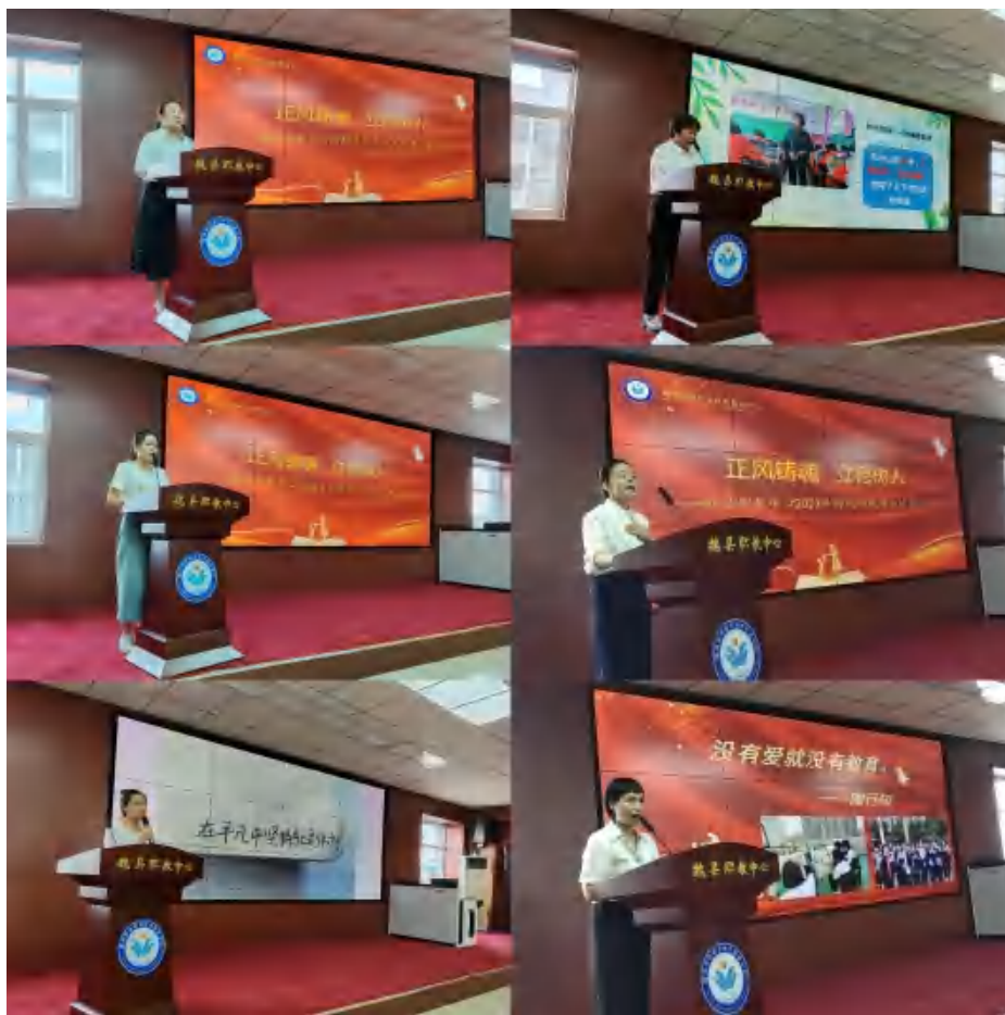
图21：师德师风演讲比赛活动

二是聚力师德建设，拓宽提升渠道，感化教师心灵，促使广大教师爱岗敬业倾心奉献。外邀专家，定期举办师德讲座，学校坚持每学期邀请全国知名德育专家，为全校教师做师德师风专题讲座。学校先后邀请了张国宏、邹六根、翁孝川、葛宏冰、余国良、陈宝峰、吕维智、李迪等10余名全国知名师德教育专家到校开展师德教育专题讲座，提升了教师师德素养。领导主讲，轮流组织师德课堂，每月固定学习时间，校领导轮流授课，教职工全体参与，集体学习国家省市关于师德师风建设的相关文件，学习各级师德先进人物感人事迹，引领大家懂政策、明是非、学先进、践行动，成为学校凝聚教师思想、提升师德水平的一道靓丽风景线。搭建平台，广泛评选师德标兵，