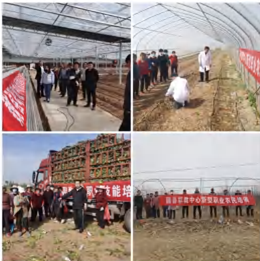
图22：实用技术培训和新型职业农民培训

承担应承担的社会责任，为乡村振兴作贡献，提升学校的社会影响力，办全县人民满意的职业教育。