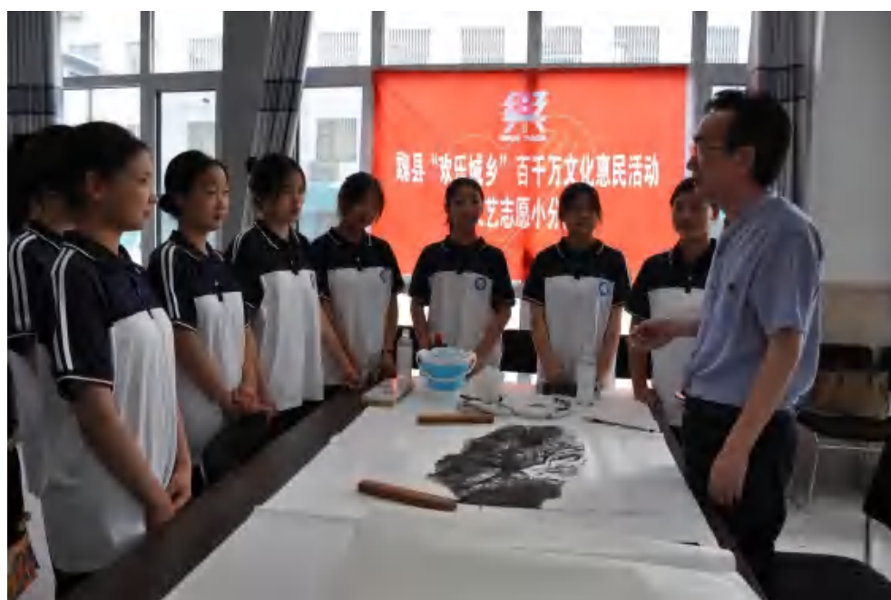
图25：书画艺术进校园活动