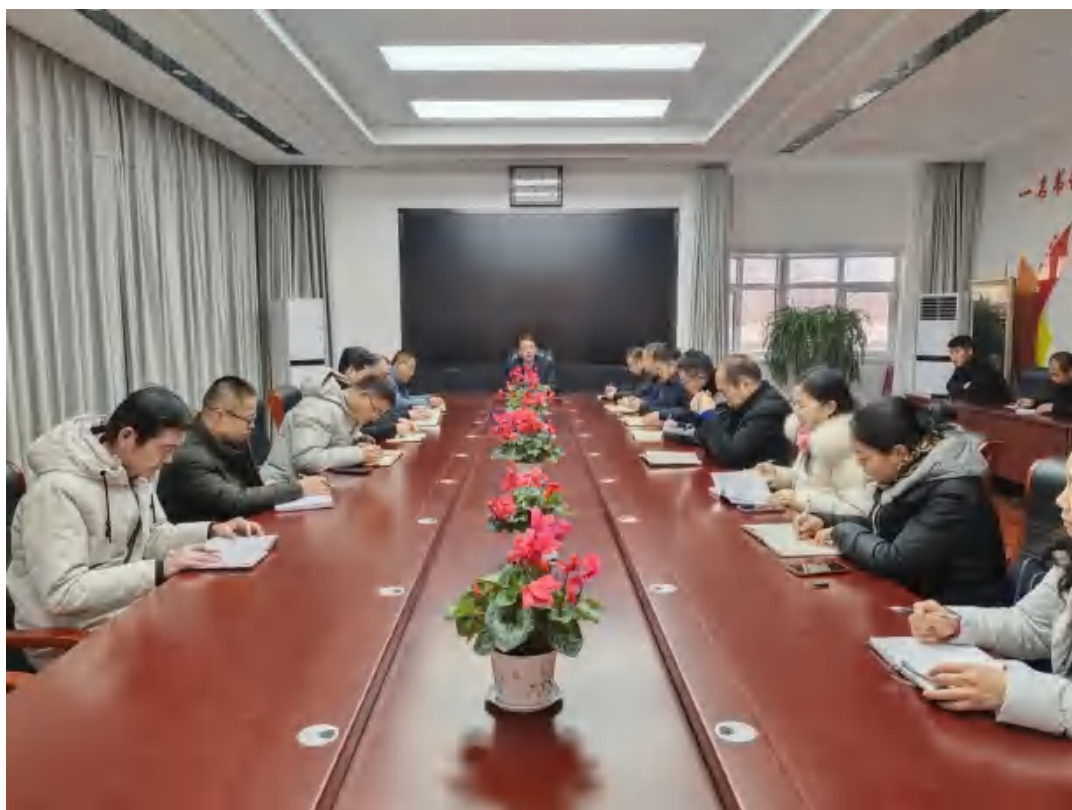
图2：领导班子（扩大）会议

学校现有教职工331人，在校生4879人，开设有计算机应用、会计事务、幼儿保育、作物生产技术、绘画、工业机器人技术应用、电梯安装与维修保养、电子商务、汽车运用与维修、铁道运输服务、卫生信息管理等11个专业。同时，根据县经济开发区企业用工需求和农业农村发展实际，有计划地开展职业培训。