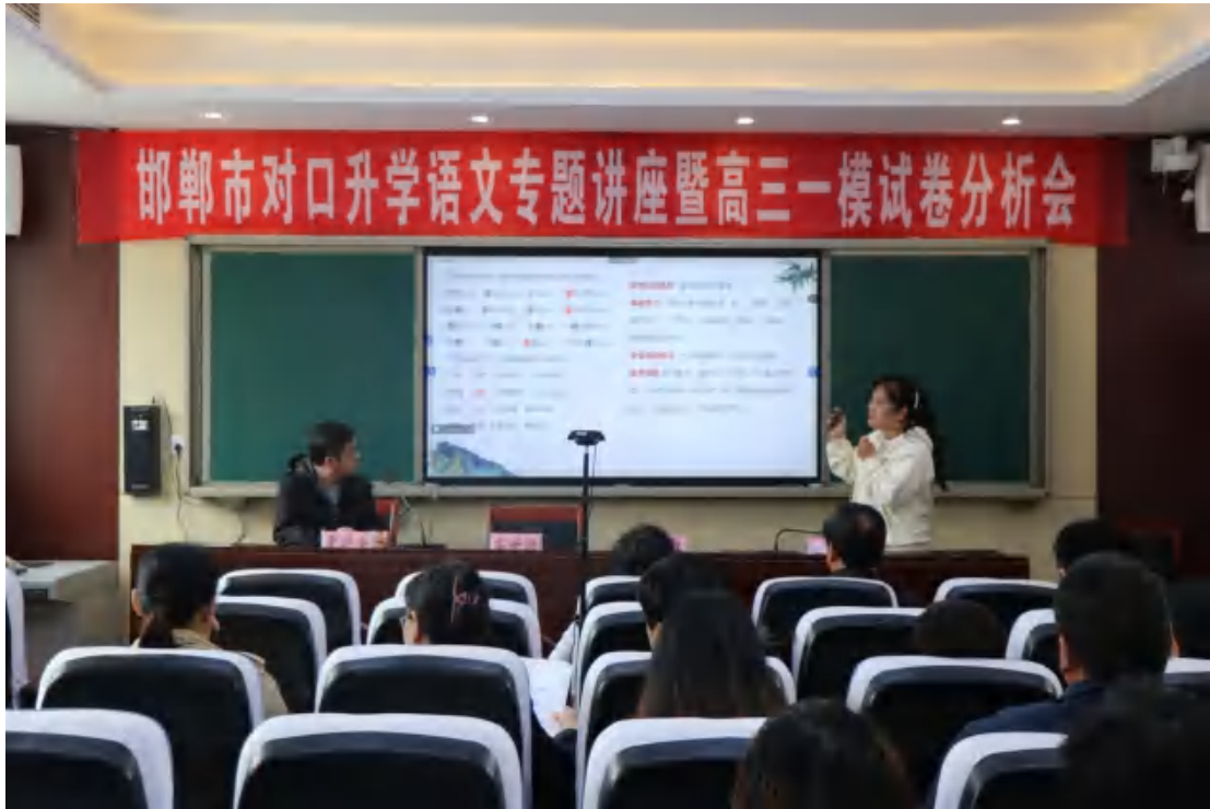
图17：邯郸市对口升学语文专题讲座暨高三一模试卷分析会