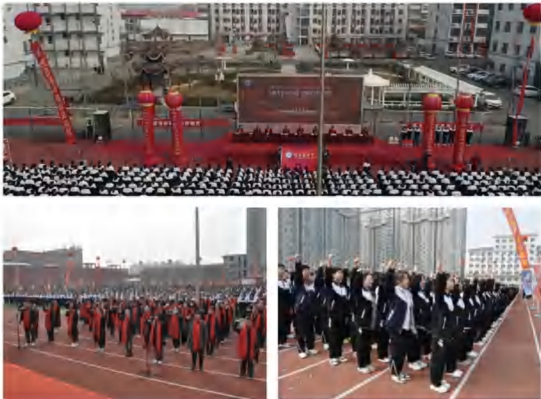
图18：2023年决战高考誓师大会