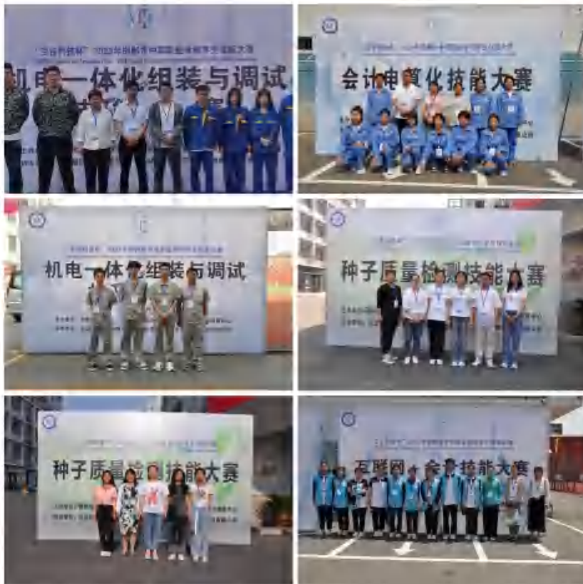
图13：2023年邯郸市中等职业学校学生技能大赛 部分学校参赛队合影留念

2.1.6创新创业。学校现有邯郸市第三批教师教学创新团队1个，为会计事务专业团队。2023年，在第四届河北省中华职业教育创新创业大赛中，学校派出的代表队，精心打磨的参赛作品《停车场车位自动分配及导航系统》，在通过前期网评和现场答辩，经过层层选拔，激烈比拼，最终脱颖而出，荣获三等奖，实现了创新创业大赛省级荣誉新的突破。在邯郸市职业院校学生创新创业大赛中，学校派出的两支代表队分别荣获“互联网+信息技术服务”项目一等奖和“互联网+现代农业”项目三等奖。