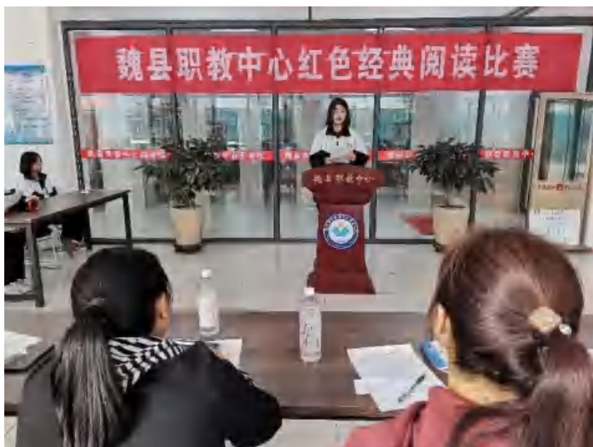
图8：红色经典阅读比赛

作方式方法，完善工作机制，以多种方式加强学生思想道德建设，学校先后组织开展了军训及入学教育、队列队形跑操比赛、