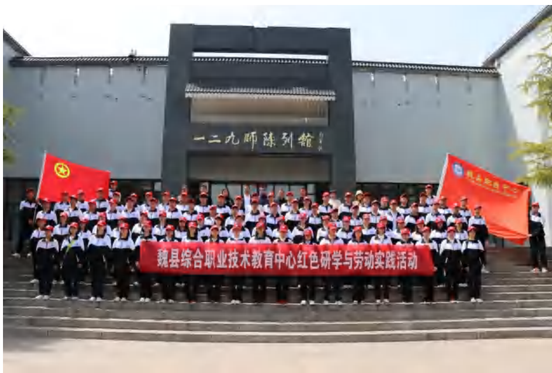
图4：红色研学与劳动实践活动

坚持党建引领发展，坚持用习近平新时代中国特色社会主义思想武装头脑、指导实践、推动工作，深入推进学习贯彻习近平新时代中国特色社会主义思想主题教育，严格按照“学思想、强党性、重实践、建新功”的总要求，加强领导，制定方案，认真组织，深入推进，把理论学习、推动发展、检视整改等贯通起来，有机融合、一体推进，确保了主题教育有力有序开展。