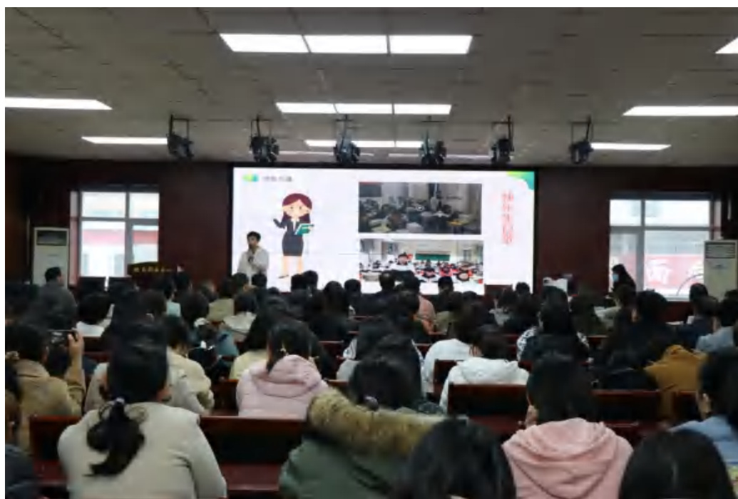
图20：“身边人讲身边事”主题师德教育故事系列活动

办法》、《教研组检查评比办法》、《实训教学管理办法》、《专业带头人和骨干教师选拔、培养与管理暂行办法》《“双师型”教师认定与培养办法》、《推荐评审高、中级专业技术职务任职资格量化测评办法》、《专业技术岗位分等级聘用操作办法》、《教师年终考核量化积分办法》等50多项管理制度和办法，在此基础上，统一编印了《教师工作手册》。科学公正地运用各项制度管理的结果。在各项制度制定过程中，学校广泛听取教师意见，力求做到细化、量化、数据化，最大程度地实现制度管理的客观化，保证了各项工作评比公平公正公开，大大激发了广大教师的工作热情，形成了比、学、赶、帮、超的浓厚氛围。