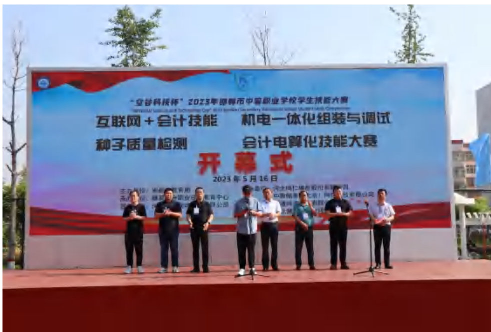
图11：2023年邯郸市中等职业学校学生技能大赛开幕式

应用能力等级鉴定培训，共培训1200人次，圆满完成了职业技能等级证书考评工作，共有285人参加考评，其中，幼儿照护150人、办公应用60人、业财一体化40人、机器人应用编程35人，通过率均为100%，为农村家庭子女就业和学生的发展创造了条件。