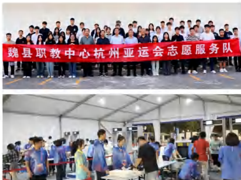
图23：第19界杭州亚运会志愿服务队出征仪式和志愿者服务活动

3.4具有本校特色的服务。2023年8月，在接到杭州亚组委邀请函后，学校高度重视，精心组织，认真开展第十九届杭州亚运会和第四届亚残运会志愿者选拔工作，共选拔优秀志愿者51名，他们以优良的个人素质和周到的志愿服务赢得了亚组委的高度评价，为呈现一届“中国特色、亚洲风采、精彩纷呈”的体育盛会做出了积极贡献，为学校和省、市、县赢得了荣誉。