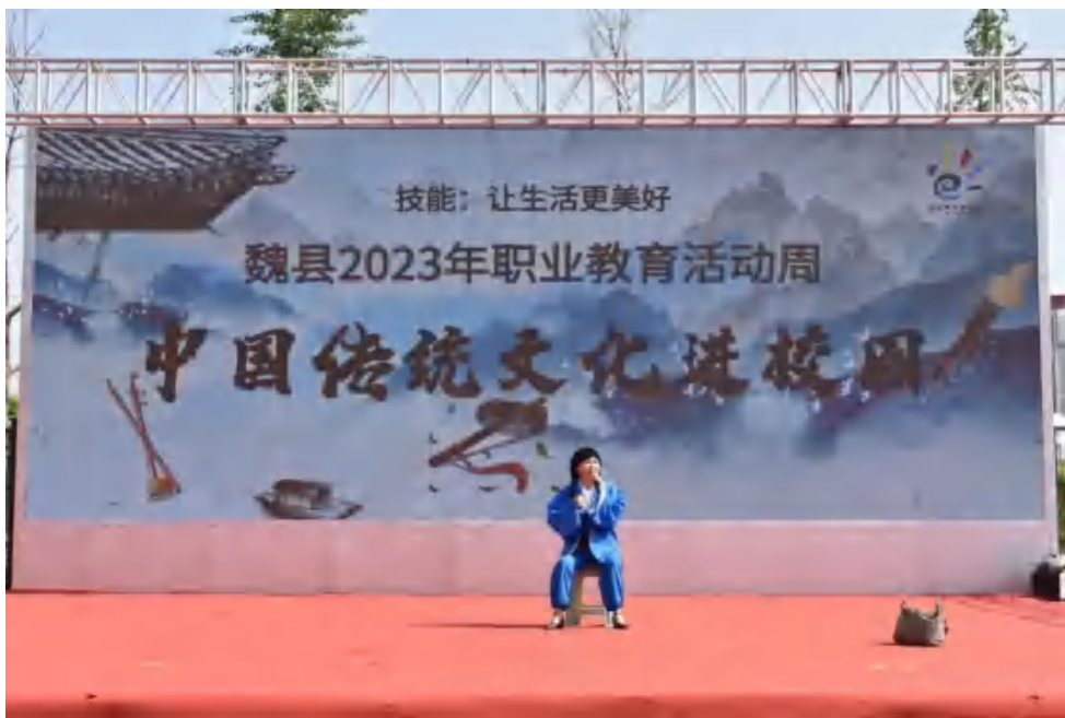
图26：中国传统文化艺术进校园活动